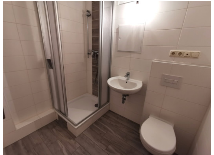
Badezimmer mit WM-Anschluss