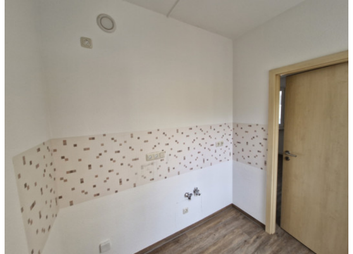
Küche mit Fenster