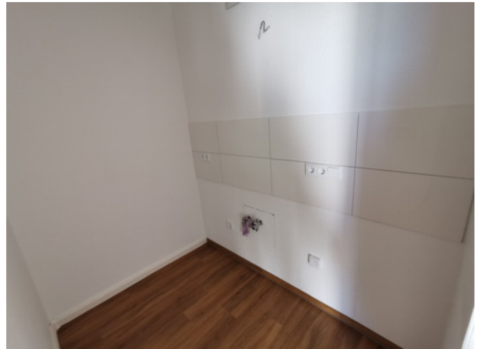
Küche mit Fliesenspiegel