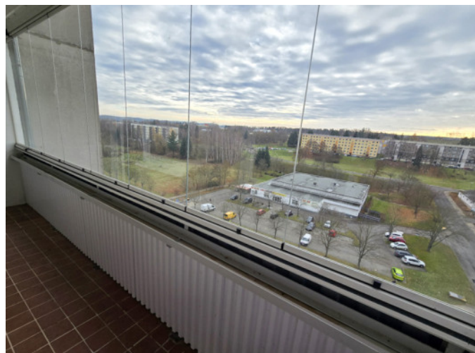
großer verglaster Balkon