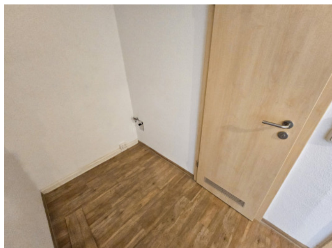
AR mit WM-Anschluss