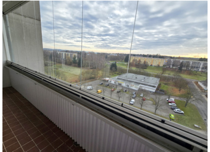
großer verglaster Balkon