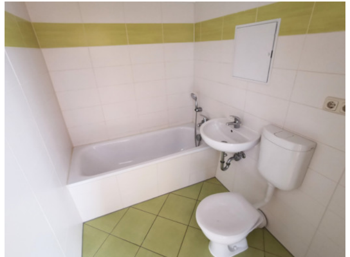
Badezimmer mit WM-Anschluss