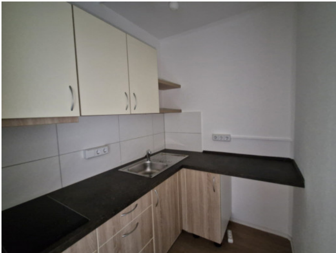
Küche mit EBK