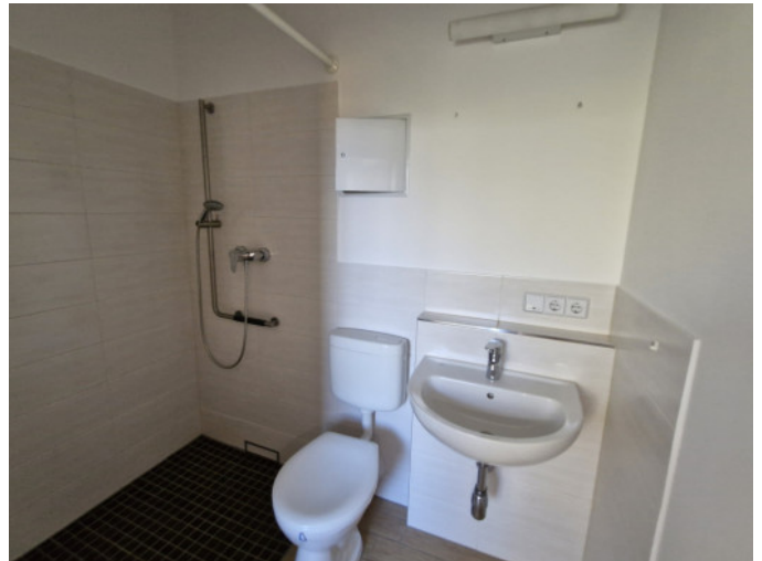
Bad mit ebenerdiger Dusche