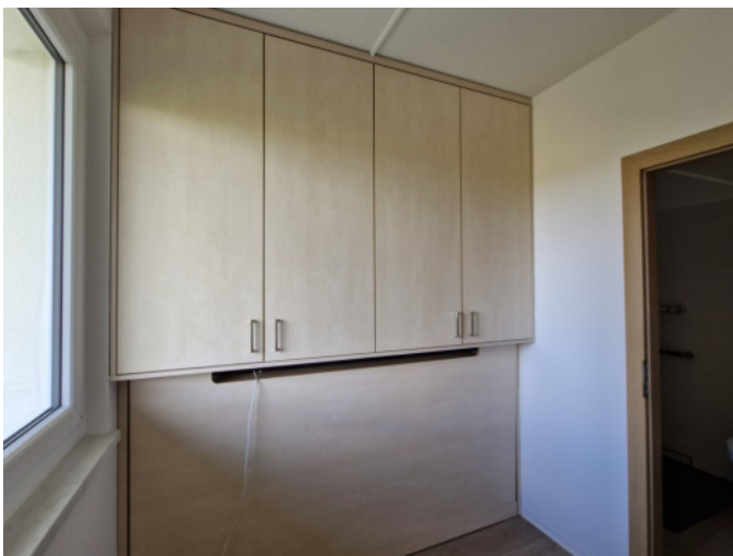
Schlafnische mit Bettanlage