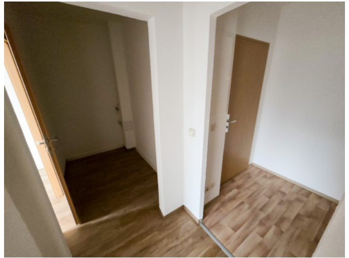
WM-Anschluss im Flur